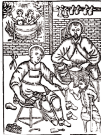
Sants patrons de l'ofici de sabater, Sant Crispí i Sant Crispinià. Estampa popular

L'edifici, rehabilitat com a museu, fou inaugurat el 2 de juny de 2010 i comprèn un espai d'àmplies dimensions que s'articula en dues plantes rectangulars; una de principal destinada a sala d'exposicions temporals, magatzem i despatxos, i un primer pis que recrea una fàbrica de calçat amb eines mecàniques de les diferents tasques del seu procés de producció utilitzades a Inca a la primera meitat del segle XX.