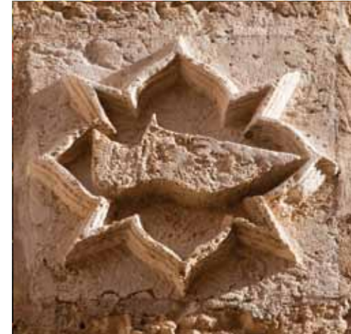
Emblema medieval del gremi de sabaters a Mallorca