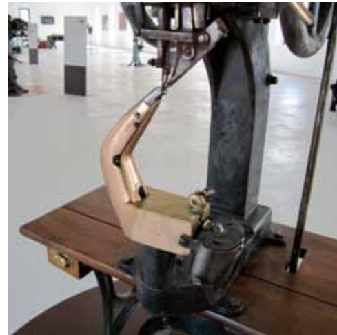
Sala d'exposició del museu. Maquinària de producció de calçat d'Inca a la primera meitat del segle XX

La finalitat és subratllar la importància del calçat com a complement indispensable de la indumentària i, per tant, de l'evolució del vestit, distingint-lo com a indicador fonamental de l'home civilitzat, en tant que és embolcall del peu nuu, i per extensió també com a dictaminador de la moda i, així doncs, vinculat al món de la creació artística.