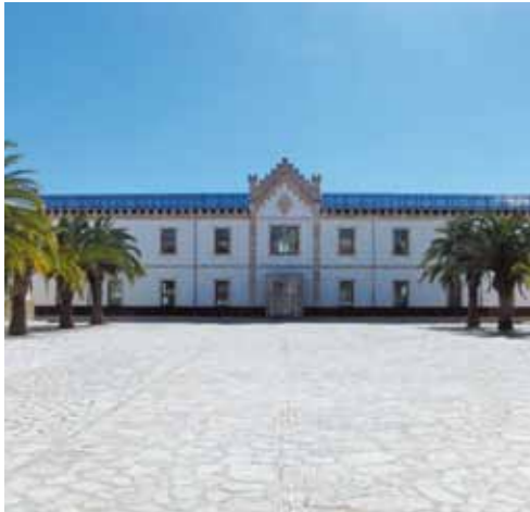
Antic pavelló militar, seu actual del museu del calçat