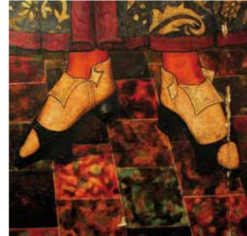
Calçat d'home a l'Edat Mitjana. Detall del retaule de Sant Cosme i Sant Damià (autor anònim. Mallorca, segle XV)