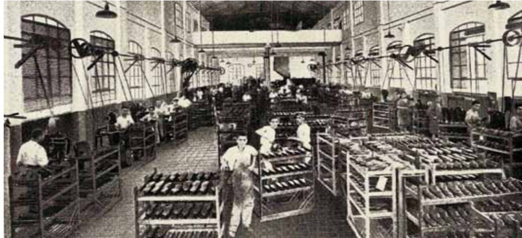
Recinte de treball de la fàbrica Melis de calçat d'Inca (ca. 1930)