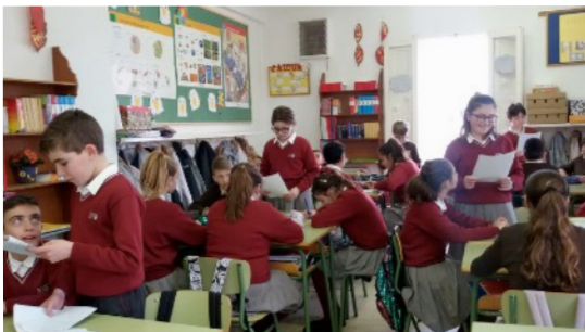
Sesiones de trabajo