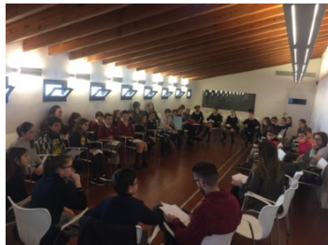
Asamblea del Consell d'infants