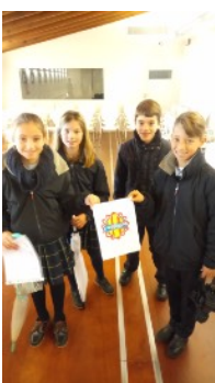
Selección del logo