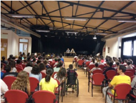
Petición oficial del alcalde para la creación del consejo de la infancia